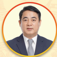
NGHIÊM XUÂN THÀNH

Ủy viên BCH Trung ương Đảng, Bí thư Tỉnh ủy