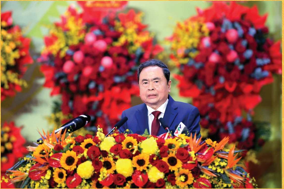
Đồng chí Trần Thanh Mẫn - Ủy viên Bộ Chính trị, Chủ tịch Quốc hội phát biểu chỉ đạo Đại hội