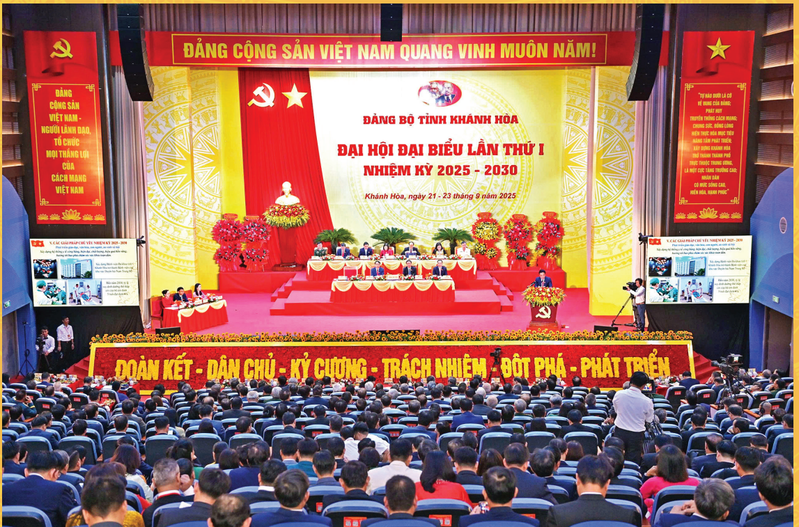
Quang cảnh Đại hội